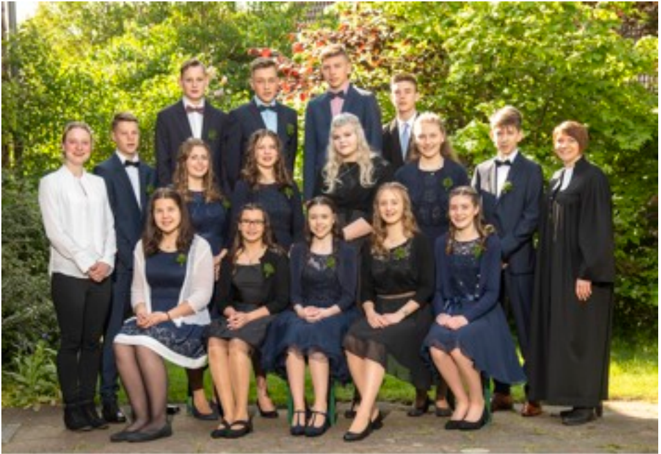
Zur Erinnerung an die Konfirmation in Schellerten am 19. Mai 2019