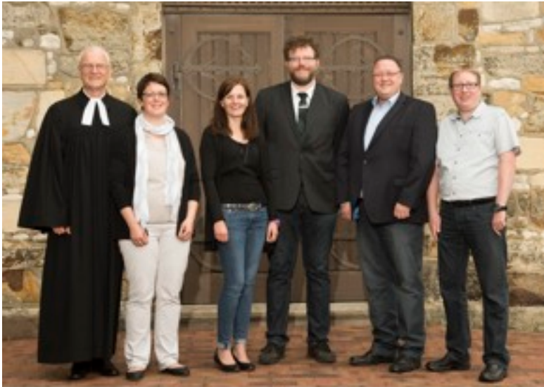
Zur Erinnerung an die Silberne Konfirmation in Kemme am 4. Sept. 2016